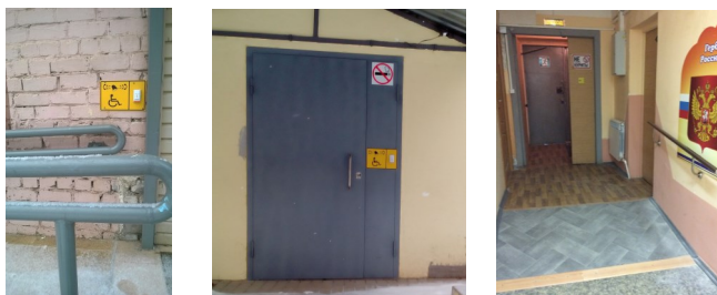
Системы вызова помощника и устройство путей доступа в здании по адресу: ул.Крупская, д.11 и ул.1-ая Красная, д.11