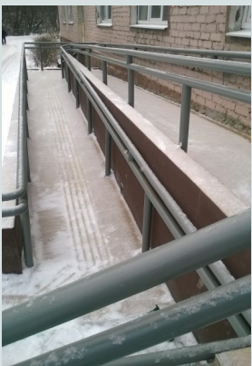
Устройство входного пандуса по адресу: ул.1-ая Красная,22а