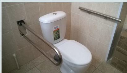
Устройство туалета по адресу: ул.1-ая Красная,22а