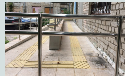
Устройство входного пандуса по адресу: ул. Крупская ,д.11