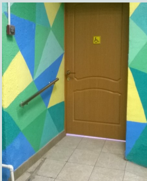
Устройство проходов в кабинеты по адресу: ул.1-ая Красная,22а