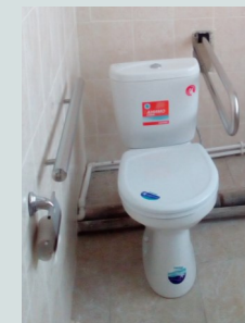
Устройство туалета по адресу: ул. Крупская, д.11